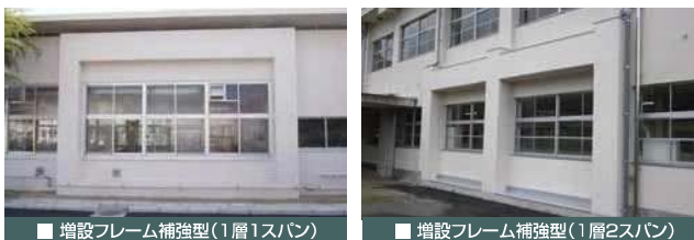
■ 増設フレーム補強型(1層1スパン)