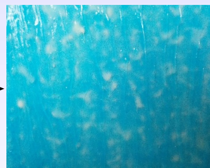
軟化・膨潤するまで放置