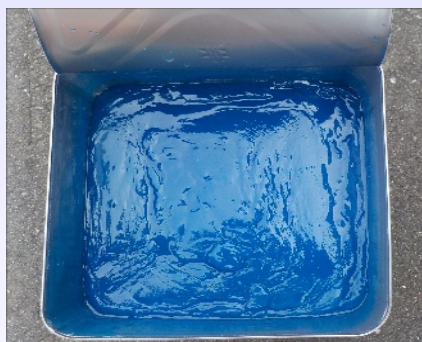
開封(希釈・攪拌をしない)