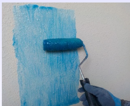
塗布(色によって塗布の有無が容易に分かります。)