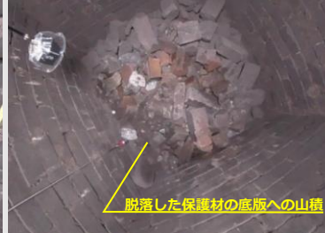
≡ 不具合箇所 3