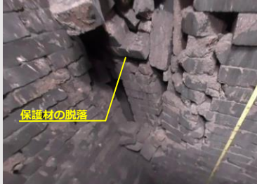
≡ 不具合箇所 2