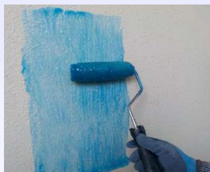
塗布(色によって塗布の有無が容易に分かります。)