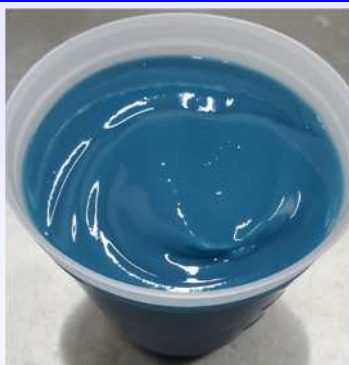
開封(希釈・攪拌をしない)