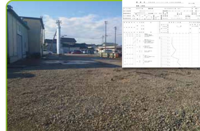
富山県高岡市石瀬 (340㎡)