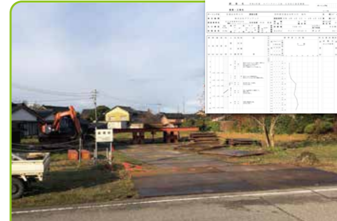
石川県宝達志水町 (1000㎡)