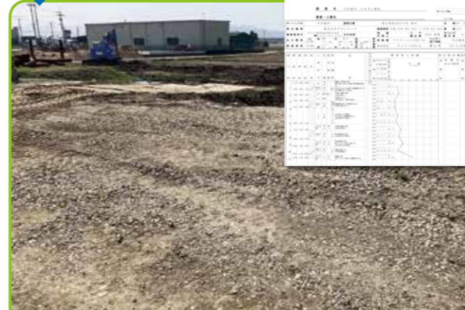
富山県射水市今井 (1200㎡)